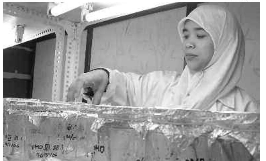
TABEL 1. NEGARA PENGIMPOR KEDELAJ TERBESAR

Di dalam Alquran dengan jelas disebutkan bahwa perdagangan atau perniagaan merupakan jalan yang diperintahkan oleh Allah