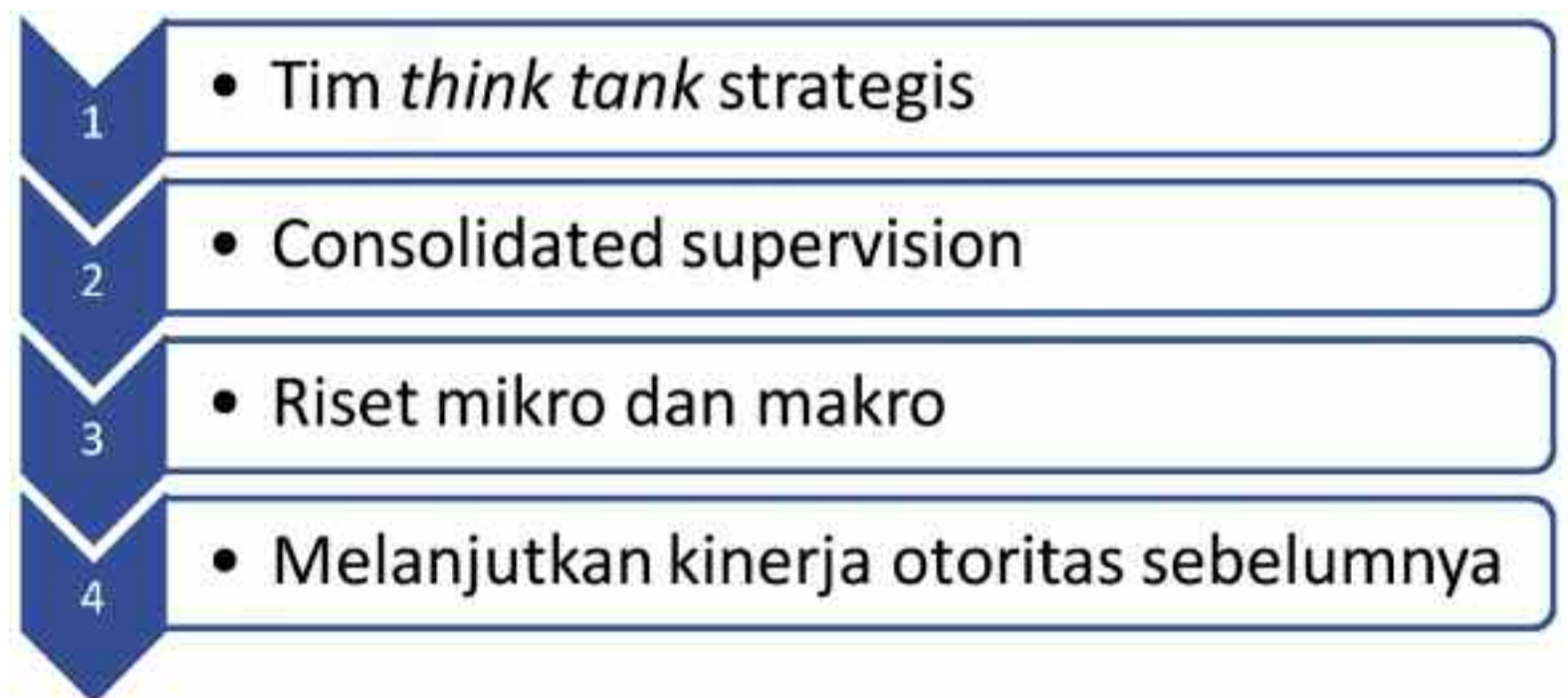
GAMBAR 1. EMPAT LANGKAH PENGEMBANGAN KEUANGAN SYARIAH DALAM OJK

Penentuan struktur dan fungsi tersebut pada akhirnya akan juga tergantung pada visi yang dimiliki oleh pemerintah dalam melihat dan mengoptimalkan potensi manfaat yang dapat diberikan oleh sistim keuangan syariah dalam mendukung mandat yang diemban oleh pemerintah untuk kesejahteraan rakyatnya. Wallahu a'lam. ■